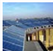
In Emilia Romagna un