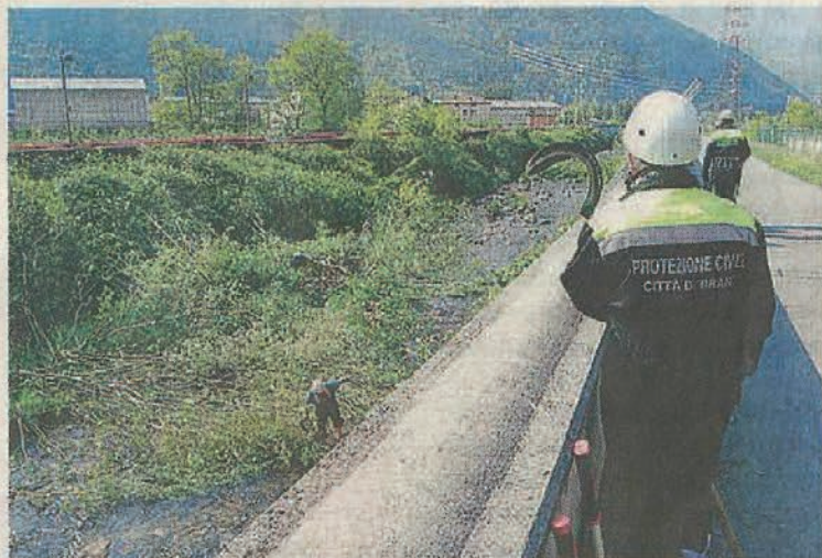
Moltissimo il materiale raccolto dopo una giornata di lavoro